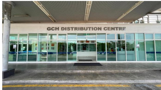
マレーシア大手スーパーGiant物流センターエントランス