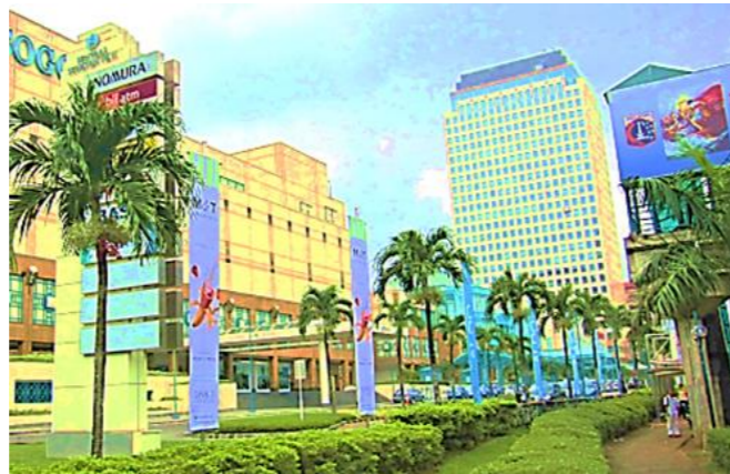
ジャカルタ南部セナヤンショッピングモール