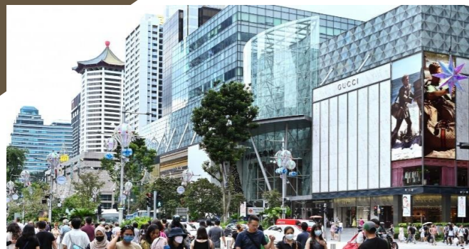
シンガポールのメインストリートオーチャード通り