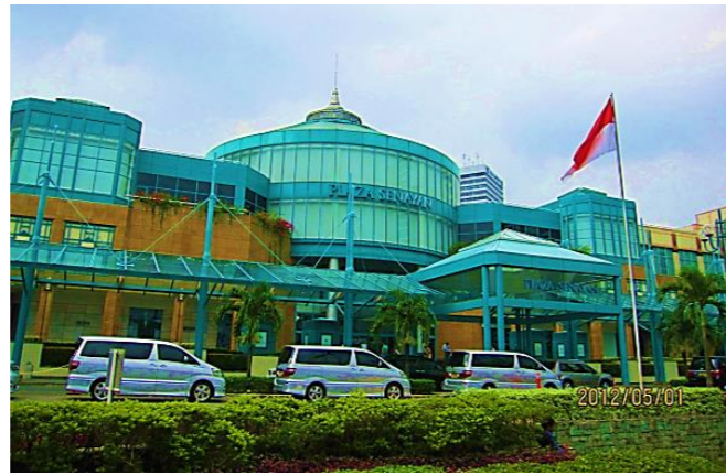
ジャカルタ南部セナヤンショッピングモール