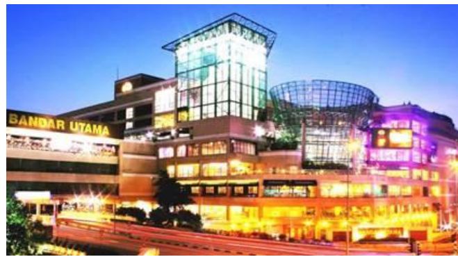
マレーシア ワンウタマ