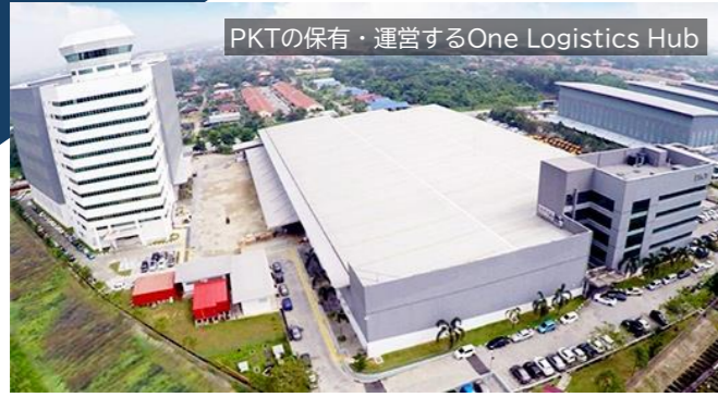
PKTの保有・運営するOne Logistics Hub

マレーシア物流業界のリーディングカンパニーPKT マレーシア大手物流企業であり、クアラルンプール近郊のシャー・アラムに所在するOne Logistics Hubをはじめとした豊富な物流施設開発実績を有している。また、物流事業に関する専門学校を現地で創設するなど、継続的な雇用の実現とマレーシア物流業界の発展にも貢献している。日本の商船三井が約35%の株式を保有している。